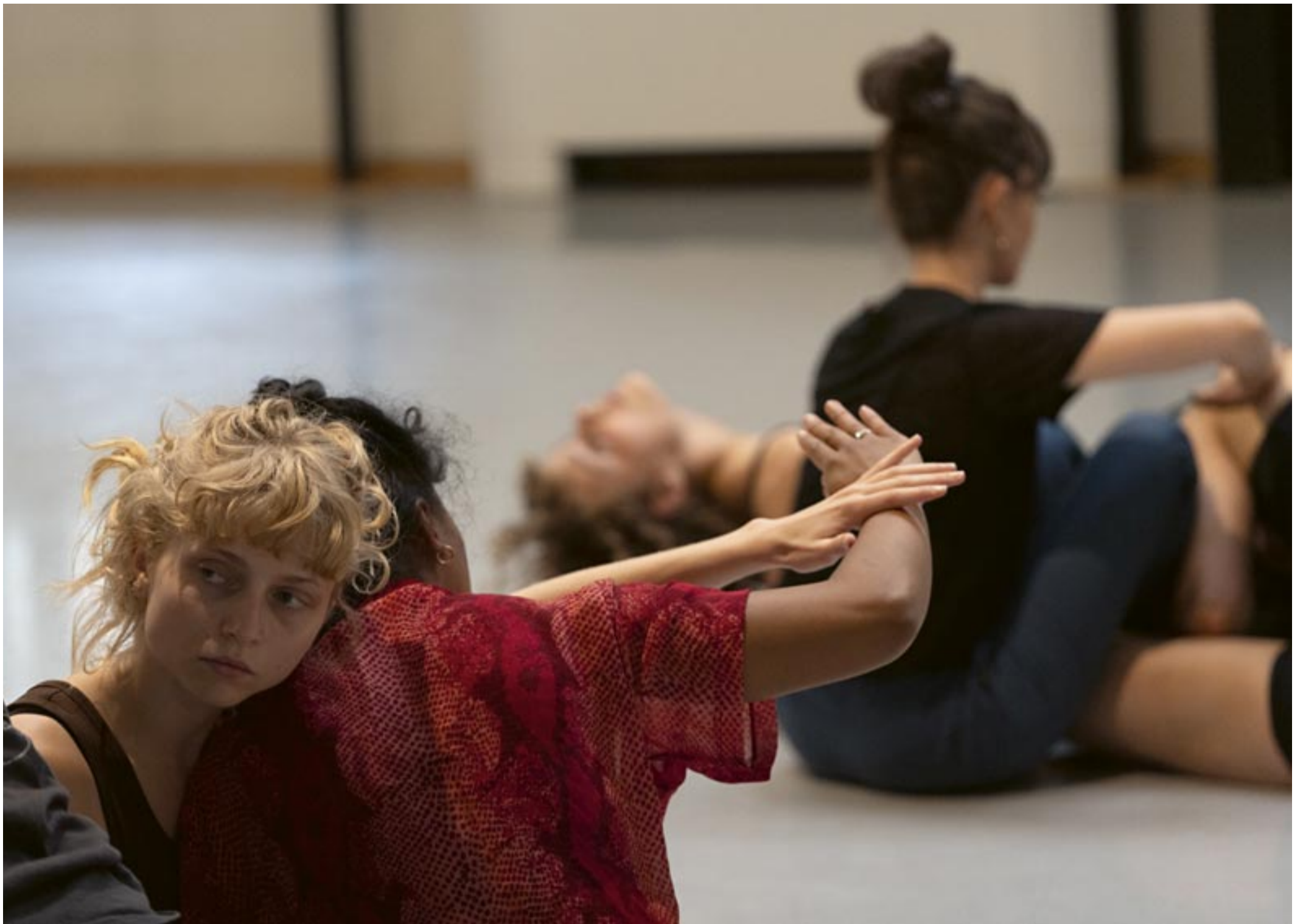
Camping Lyon, 2024