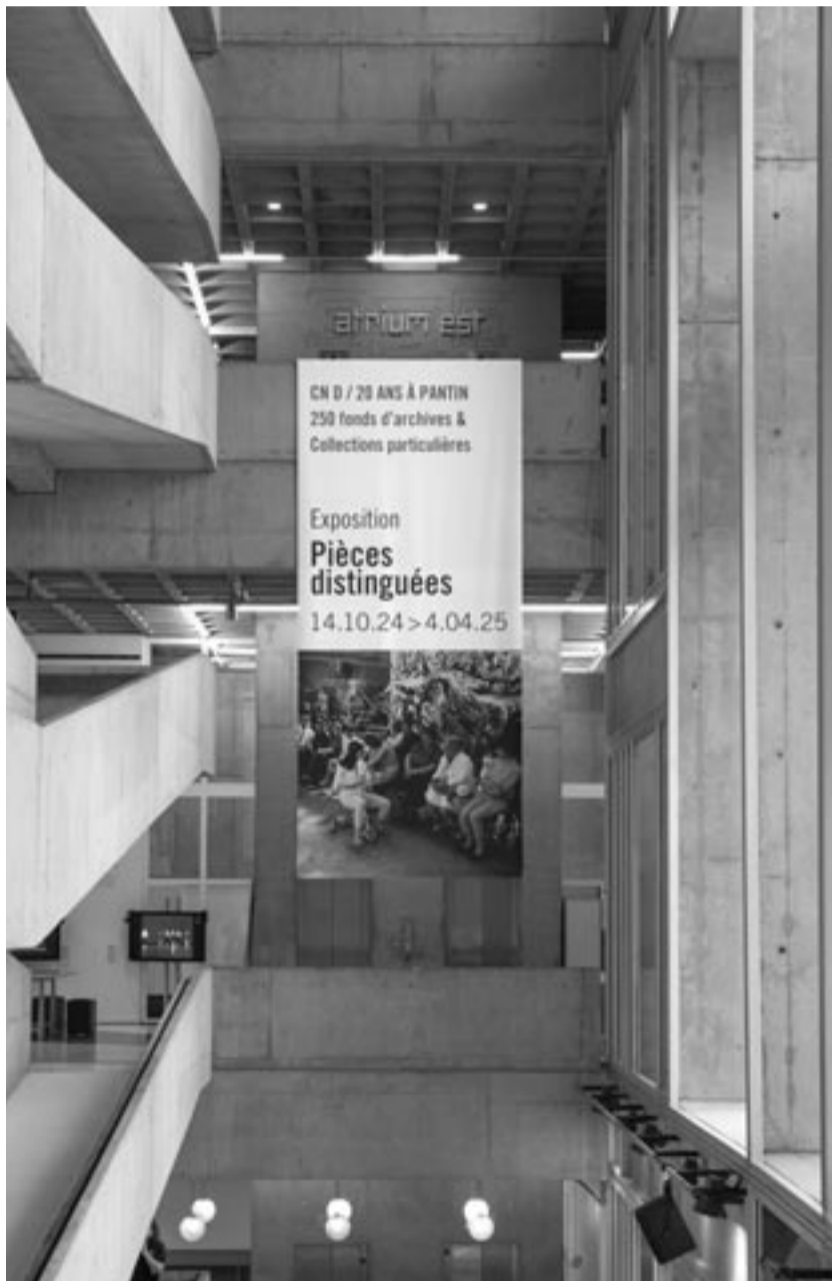
Prise de vue de l'exposition Pièces Distinguées

À l'occasion des vingt ans du CN D à Pantin, l'exposition Pièces distinguées propose un dévoilement paradoxal des quelque 250 fonds d'archives et collections particulières - d'artistes, de critiques et chercheurs, de photographes et vidéastes, de balletomanes ou encore de structures et professionnels de la danse - rassemblés par la médiathèque du CN D depuis sa création. Au fil de l'exposition, chacun pourra relier ces traces à son idée du domaine ou son histoire avec la danse, reconnaître une démarche, un réseau ou un lieu, ou bien, à l'inverse, s'étonner d'un écrit, se laisser saisir par des images insoupçonnées, ouvrir sa perspective sur l'art chorégraphique et ses acteurs.