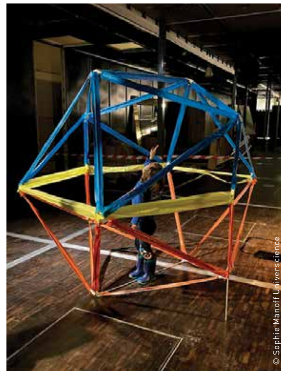
Kinésphère - Tests effectués à la Cité des sciences et de l'industrie avec les enfants de la classe de maternelle Joliot Curie de Pantin pour l'exposition « Danser », octobre 2023.