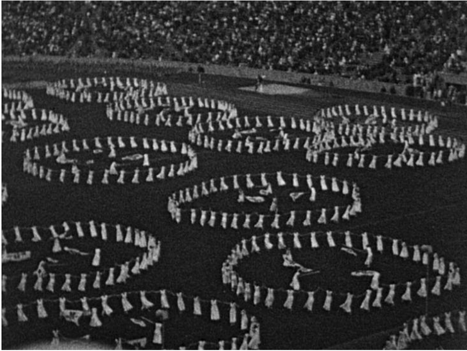
Les Jeux d'Hitler, Berlin 1936 , Jérôme Prieur (2016)