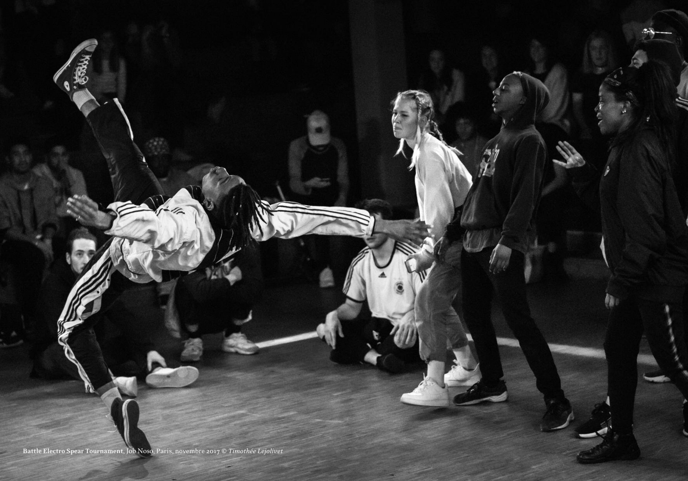
Battle Electro Spear Tournament, Job Noso, Paris, novembre 2017