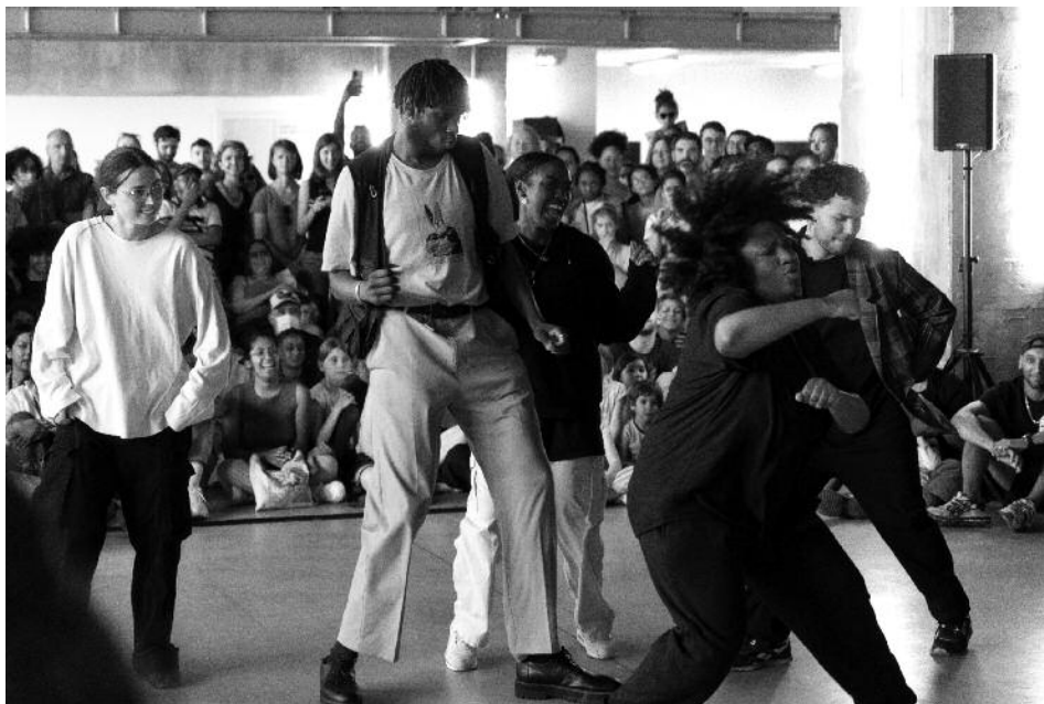
1 km de danse 2022, battle