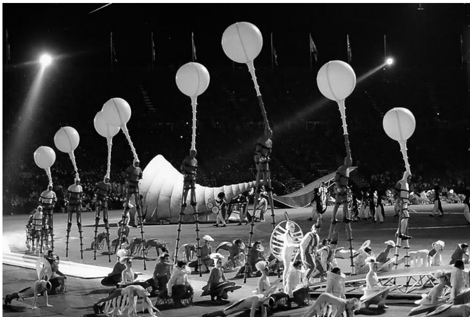
Jeux olympiques d'Albertville, France. Vue générale de la cérémonie d'ouverture, direction artistique Philippe Decouflé, 8 février 1992