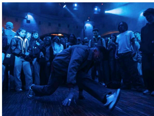
Freestyle Vilette, maison dédiée aux expressions populaires et cultures urbaines ouvre ses portes dans le parc de la Vilette, 4 octobre 2025 ⓘ

Le 8 novembre, on pourra assister à la finale du concours de rap RappeuZ , dont l'ambition est de dénicher les nouveaux talents féminins du rap partout en France ; elles seront 12 à concourir, accompagnées aux platines par les DJs Toopsie et Skyleia. En décembre, ce sera au tour du festival En corps , porté par le centre culturel La Place, de transporter les visiteurs lors d'une prometteuse soirée house .