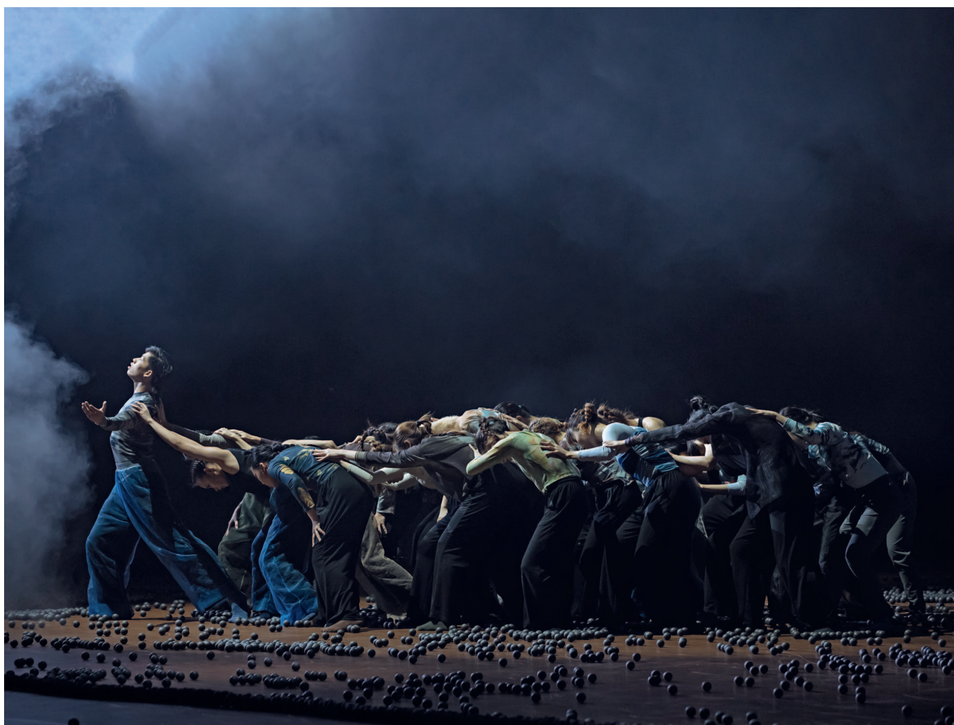
Hong Kong Academy for Performing Arts