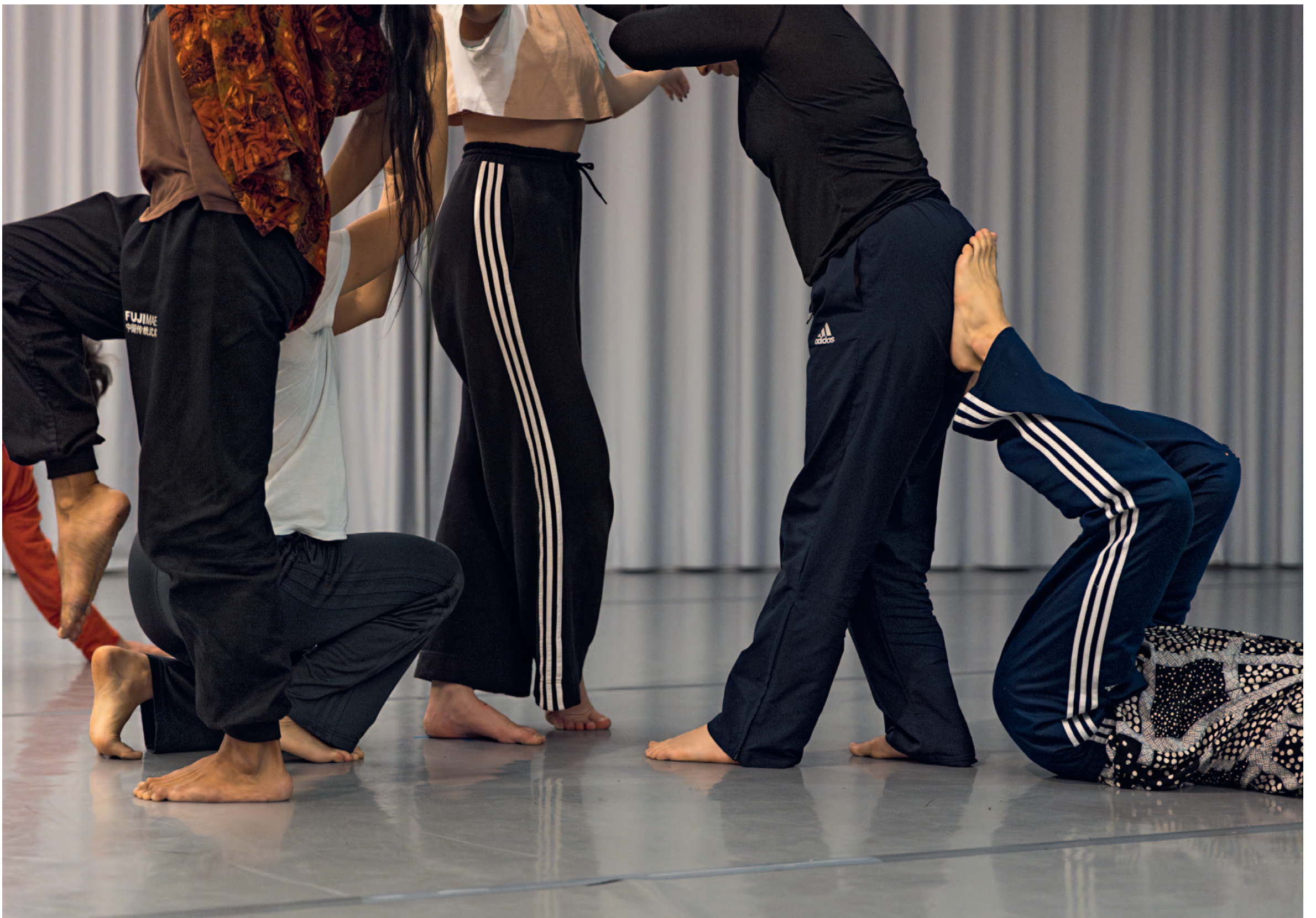
Extensions, La Place de la Danse - CDCN Toulouse/Occitanie