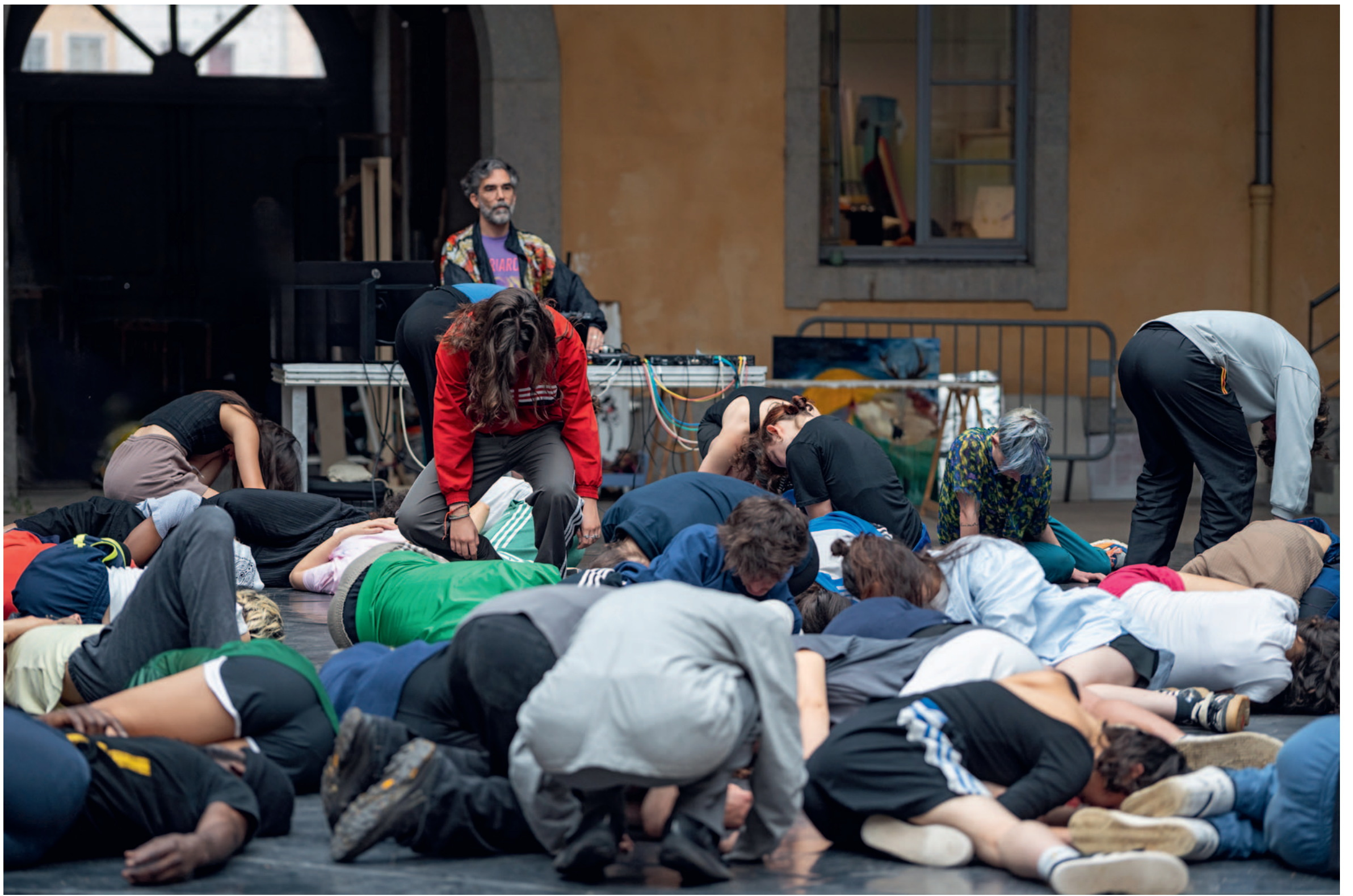
Camping Lyon 2024, CN D Centre national de la danse