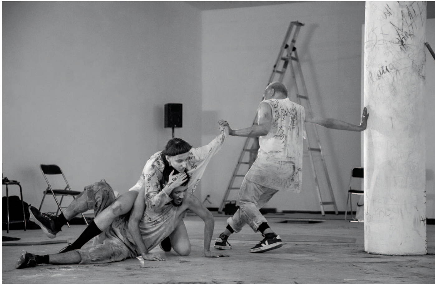
Master Exerce, ICI-CCN Montpellier/Occitanie Pyrénées-Méditerranée