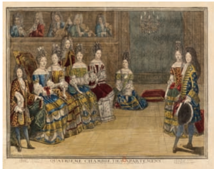
« Quatrième chambre des appartemens » Estampe Antoine Trouvain, Paris, 1694

Sous le règne de Louis XIV (1643-1715), le bal est organisé pour permettre au roi de montrer l'éclat de sa cour. Il joue un rôle majeur dans un milieu où « paraître » est essentiel pour « être ». [...]