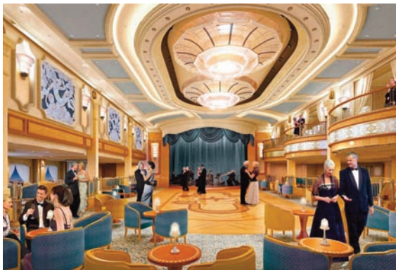
La salle de bal du paquebot Queen Elizabeth Image de synthèse Compagnie Cunard, s.l., 2010 © Compagnie internationale de croisières - Cunard Line

Commissaire scientifique : Virginie Garandau