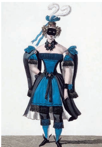
Costumes d'une Espagnole pour l'opéra Gustave III ou Le Bal masqué d'Eugène Scribe et Daniel Auber Estampes Louis Maleuvre, in Galerie Hauteceur-Martinet , Paris, 1833