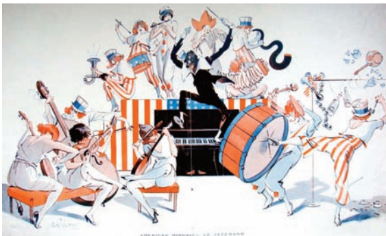
« American Miousic... ! Le jazz-band » Dessin René Préjelan, paru dans La Vie parisienne , s.l.s.d. Collection particulière, DR