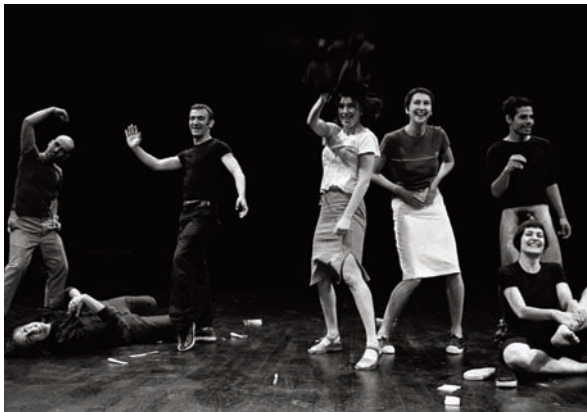
The Show Must Go On de Jérôme Bel. Montpellier, 2000