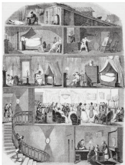
Coupe d'un immeuble parisien Dessin Karl Girardet, in Édouard Charton (dir.), Le Magasin pittoresque , Paris, 1847

Arrivée d'Angleterre à la fin du XVII e siècle, la contredanse devient la principale danse de bal au siècle suivant. N'accordant aucune importance à la hiérarchie et au cérémonial, elle est ludique et explore toutes les possibilités de relations entre les individus et les couples. [...]