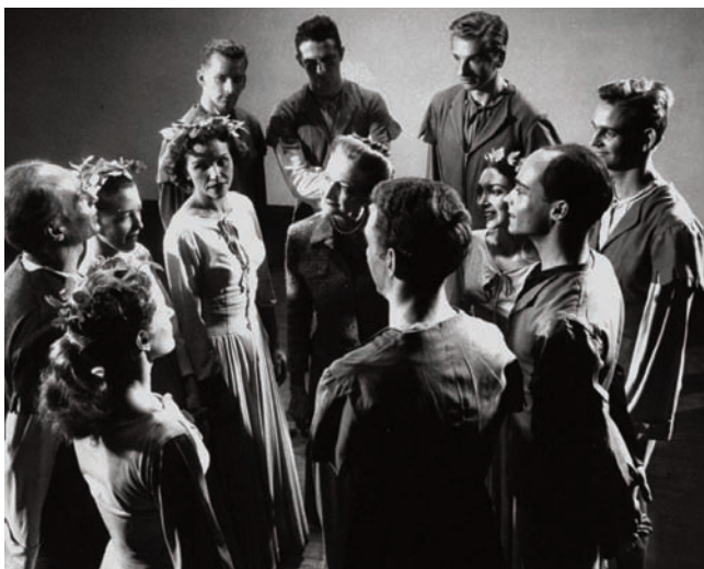
Doris Humphrey, New York, 1950

Interprètes Étudiants de 3 e , 4 e années classique et contemporain.