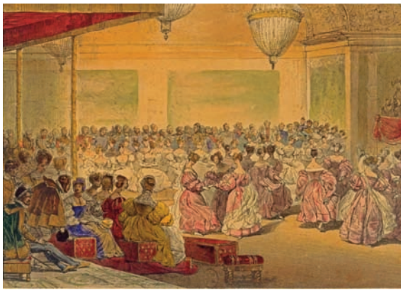
Le quadrille de Marie Stuart donné le 2 mars 1829 au château des Tuileries par la duchesse de Berry Lithographie Eugène Lami, Paris, 1829