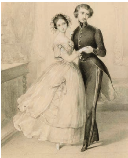
La valse à trois temps. Dessin Anaïs Colin, s.l., 1844 Bibliothèque-musée de l'Opéra / BnF

Après la rupture de la Révolution et avec la succession des régimes politiques, de nouvelles élites émergent, renforçant la pratique du bal en cercles sélectifs. Les liens entre noblesse et haute bourgeoisie (alliance du nom et de la fortune) se multiplient. Le bal occupe une place centrale dans les stratégies d'intégration à l'élite. [...]