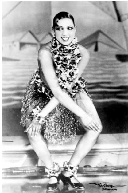
Joséphine Baker dans La Folie du jour aux Folies-Bergère Photo Lucien Waléry, Paris, 1926 Beinecke Library, Yale University