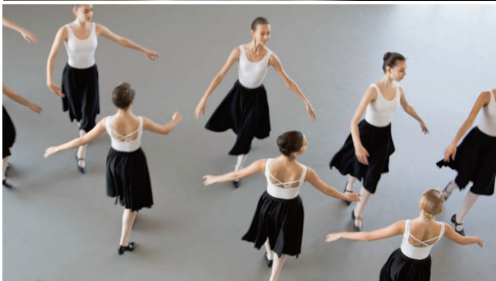
Répétitions au CNSMDP

Direction artistique et présentation Roxana Barbacaru Interprètes Avec les étudiants danseurs du CNSMDP de 1 ère , 2 ème , 3 ème et 4 ème années classique