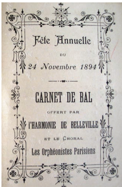
Carnet de bal offert par l'harmonie de Belleville et le Choral « Les Orphéonistes parisiens » pour la fête annuelle du 24 novembre 1894 Couverture, Paris, 1894 Médiathèque du CND, fonds Gilberte Courmand