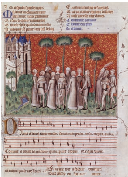
« Machaut retrouvant sa dame » Partition Guillaume de Machaut, enluminure Maître du Remède de Fortune, in Le Remède de Fortune, Paris, c. 1350-1355