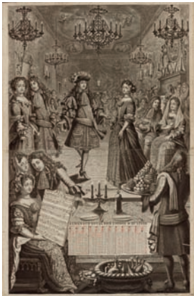
« Bal à la française » Almanach royal pour l'année 1682 Estampe Pierre Landry, Paris, 1682 © Bibliothèque municipale de Versailles : Almanach Royal 1682

DU 5 MAI AU 10 JUIN - THÉÂTRE NATIONAL DE CHAILLOT