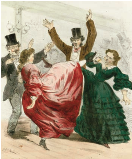
La Rigolbochomanie Dessin Charles Vernier, lithographie Destouches, s.l., c. 1860 Collection particulière

DU 5 MAI AU 10 JUIN - THÉÂTRE NATIONAL DE CHAILLOT