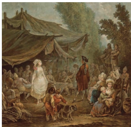
Noce de village Gravure Charles-Melchior Descourtis, peinture Nicolas Taunay, Paris, XVIII e siècle

Dès la fin du XIX e siècle en France, les reconstitutions de danses anciennes intéressent les chorégraphes. Pourtant, la « belle danse », dite aujourd'hui « danse baroque », n'est redécouverte qu'un siècle plus tard grâce à une démarche à la fois scientifique et artistique, initiée par Francine Lancelot. [...]