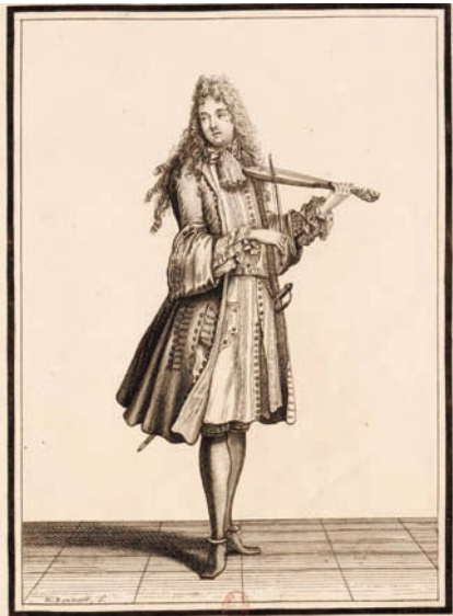
« Maître à danser » Estampe Nicolas Bonnart, Paris, 1675

DU 5 MAI AU 10 JUIN - THÉÂTRE NATIONAL DE CHAILLOT