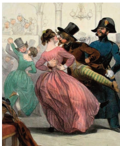
La Polkamanie : la polka des bals publics Illustration Charles Vernier, Imprimerie d'Aubert, Paris, 1844 Médiathèque du CND, fonds Gilberte Courmand

Le bal occupe une place de choix dans les jardins d'agrément, vauxhalls ou tivolis, qui se multiplient à Paris sous Louis XV (1715-1774). En 1781, lorsque Louis XVI ordonne la construction du mur des Fermiers généraux, de nombreux débits de boisson s'implantent hors les murs. Des bals que l'on appellera rapidement les « guinguettes » s'y installent. [...]