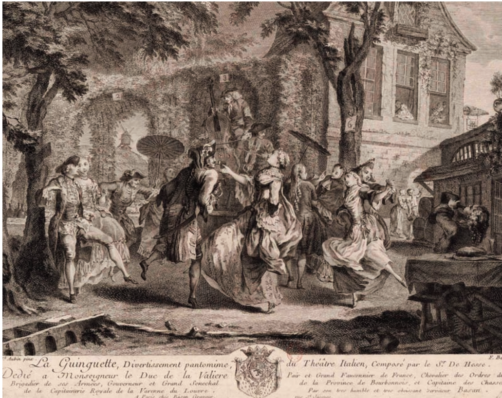
La Guinguette , divertissement pantomime du Théâtre-Italien, de Jean-Baptiste Dehesse Gravure Pierre-François Basan d'après Gabriel de Saint-Aubin, Paris, 1772 Bibliothèque-musée de l'Opéra / BnF

CONFÉRENCE — CND PANTIN / STUDIO 3 MARDI 8 FÉVRIER À 18H