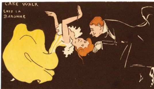
Le Cake-walk chez la baronne Carte postale anonyme, s.l.s.d. Médiathèque du CND, fonds Gilberte Courmand, DR

Au XIX e siècle, on voit fleurir une multitude de danses en couple fermé où les danseurs se tiennent enlacés. La valse fait d'abord son apparition, suivie de la polka, la mazurka, la redowa ou la scottish. Empruntées au répertoire folklorique européen, ces danses sont adaptées aux normes du monde élégant parisien. Elles viennent aussi nourrir le répertoire populaire. [...]