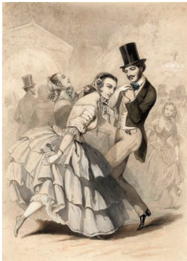
Les bals à Paris : le château des fleurs Illustration Charles Vernier, s.l.s.d. Collection particulière.

Danse savante/danse populaire : deux expressions que l'on a coutume d'opposer.