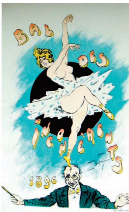
« Bal des Incohérents » Affiche Maurice Neumont, s.l., 1896 Collection particulière

Les dangers du bal ne laissent insensibles ni les religions ni la médecine. Au fil du temps, les danses de société font souvent l'objet d'une vive réprobation morale. Liées au tabou de la sexualité, elles suscitent des propos indignés sur la dépravation des mœurs. Ces jugements réactionnaires n'ont en général que peu d'incidence concrète sur la pratique. [...]