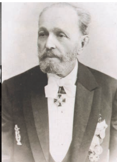
Marius Petipa, St. Petersburg, 1898. Collection privée.

Au cours du XX e siècle, la danse moderne renouvelle le langage chorégraphique en puisant dans les danses de société des deux côtés de l'Atlantique.