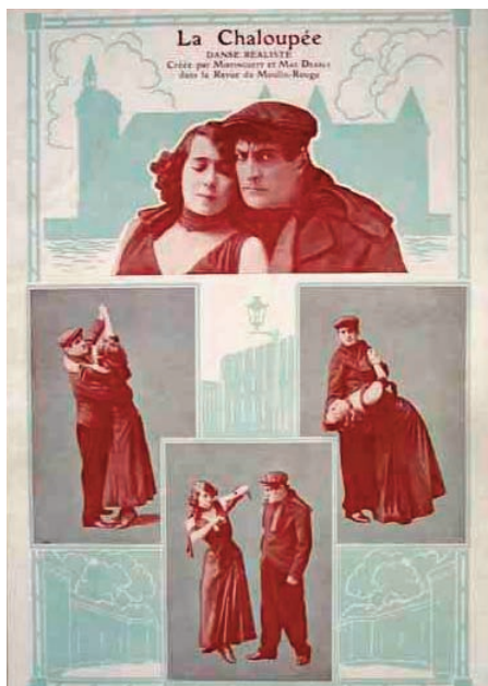
La Chaloupée de Mistinguett et Max Dearly, dessin L. Schmittbuhl, s.l., 1909 Médiathèque du CND