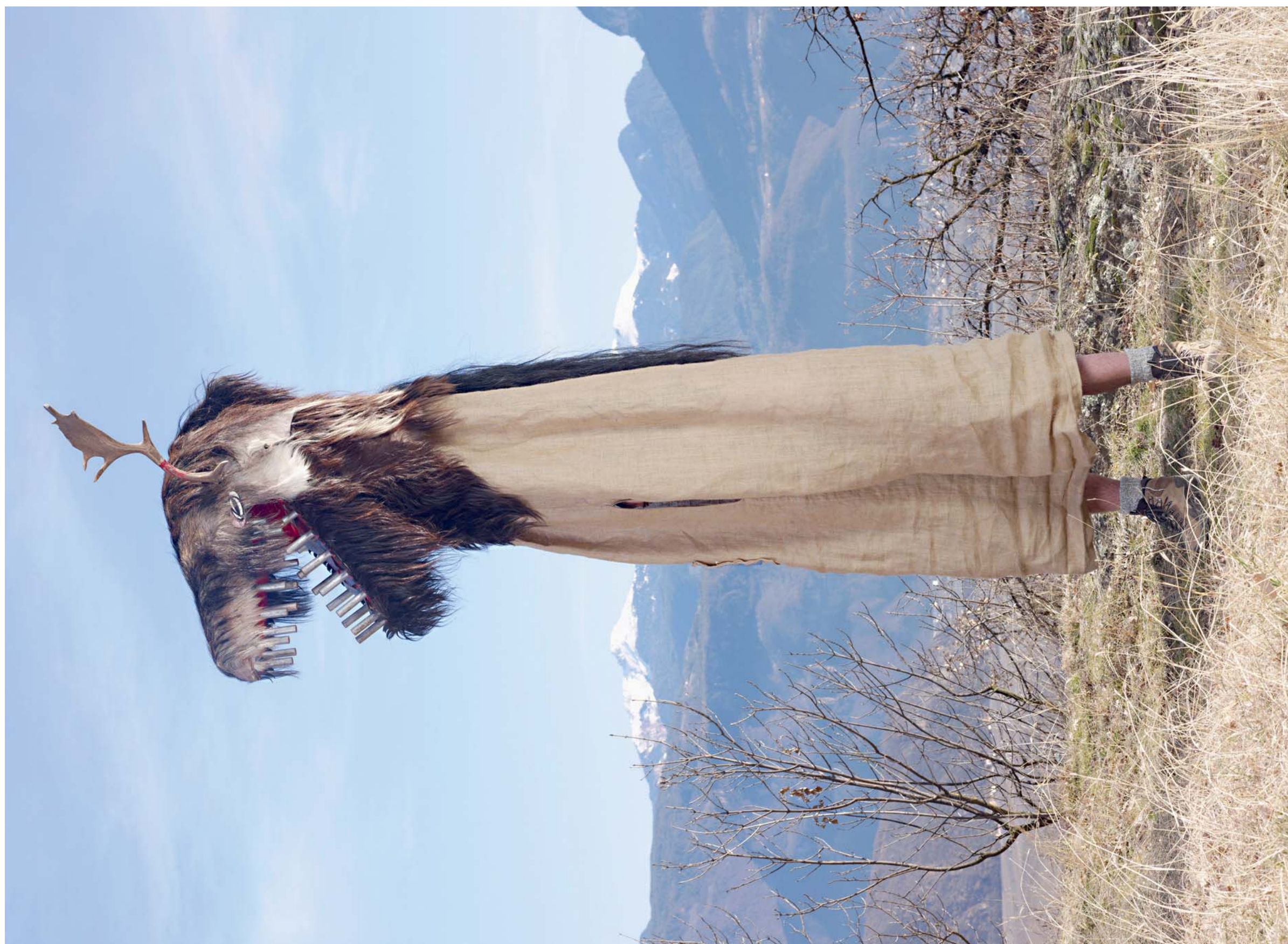
Charles Fréger, Schnappstecher, WILDER MANN, 2011