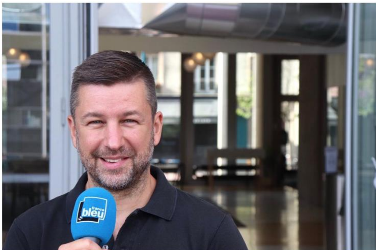
Christophe Susset © Radio France - Quentin Lhuissier