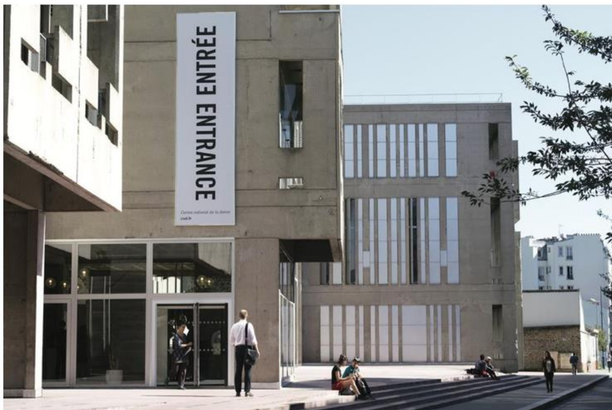
Le CND

Bon, ce bâtiment à mal commencé... On y retrouvait toutes les administrations de Pantin, autant dire qu'on y venait pas forcément par plaisir... maintenant, c'est tout l'inverse puisqu'il est devenu le Centre National de la Danse . Mélange de béton et verre, cette construction a reçu le prix de l'Equerre d'argent après sa réhabilitation en 2004.