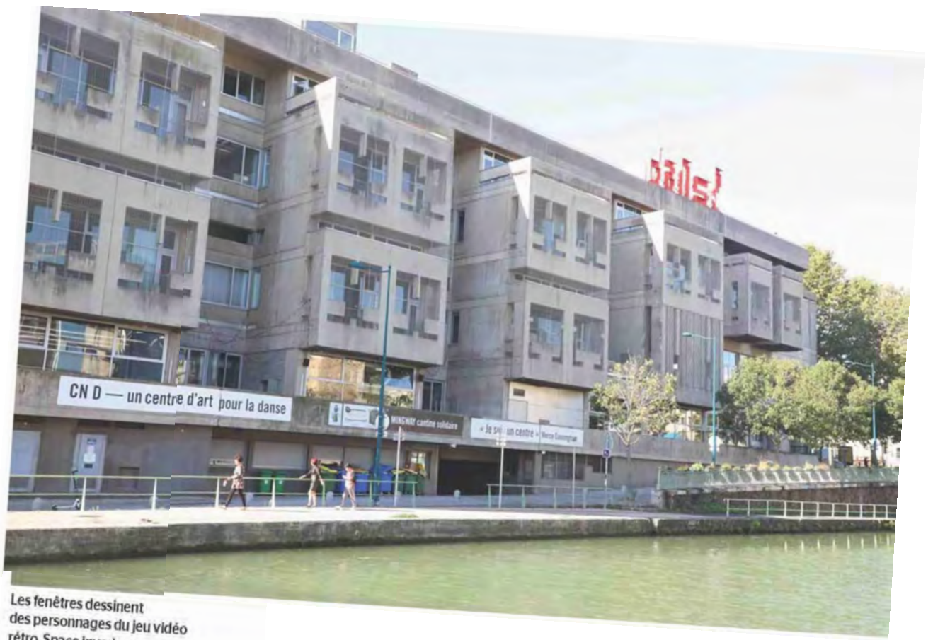
Les fenêtres dessinent des personnages du jeu vidéo rétro, Space Invaders.