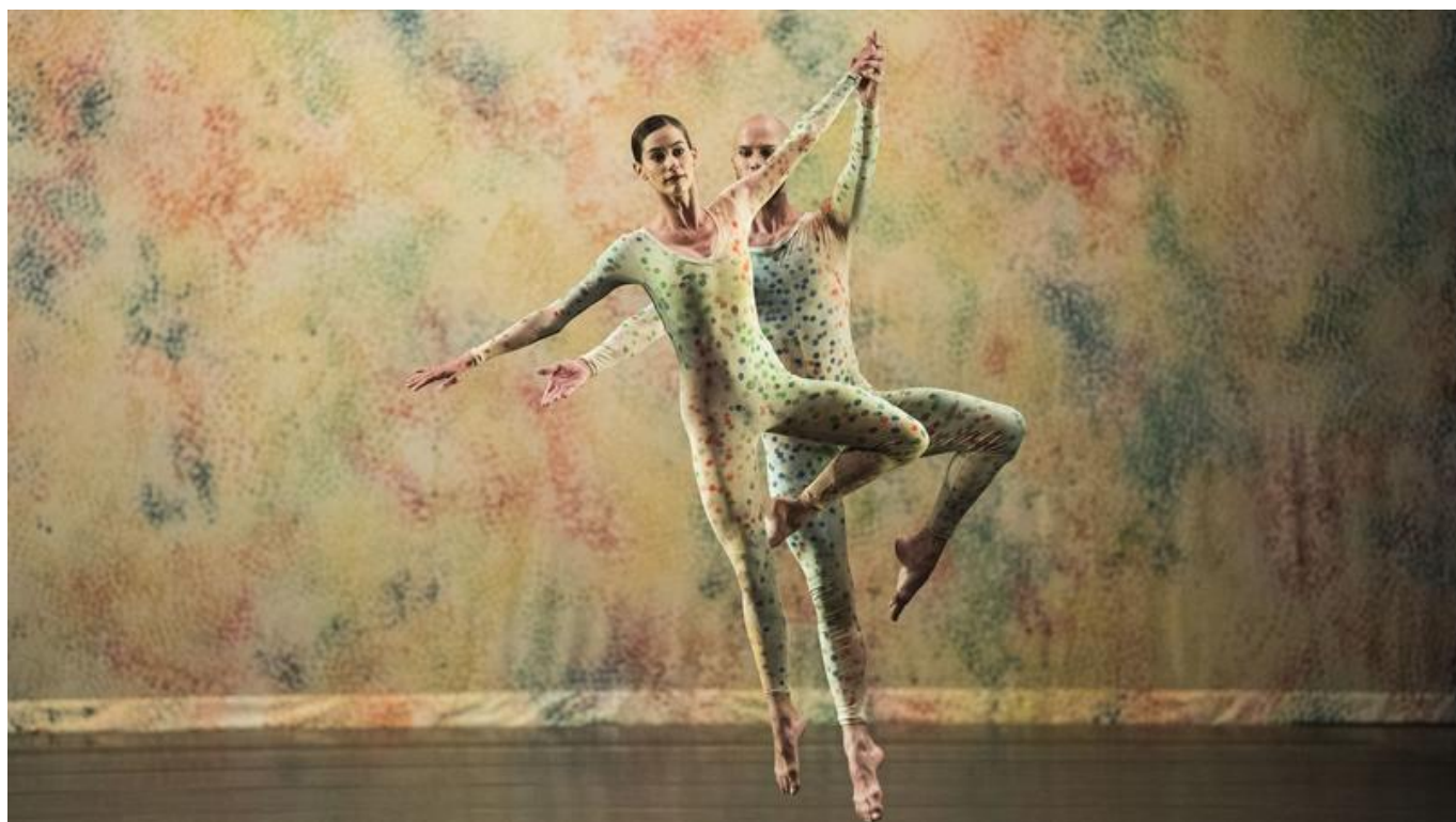
Summerspace, une création de Merce Cunningham, reprise lors du Festival de Montpellier en juin dernier.